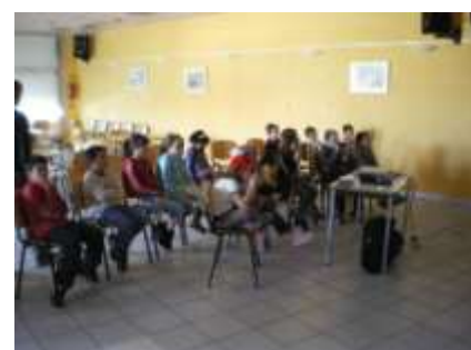
La salle de conférence