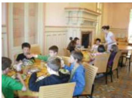
La salle de restauration