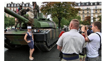
"Eclats de guerre" - © Adrien Fauchoux, 2011.

Ce film est le fruit d'une période de vie au Liban, et notamment du conflit de juillet 2006. La guerre y est évoquée, intériorisée, anticipée. A nous autres Européens, qui n'avons pas vécu de guerre sur notre propre sol depuis plusieurs générations, le film tente de faire entrevoir ce que la guerre peut représenter en tant que phénomène.